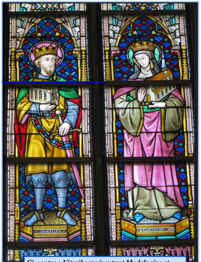
Ci-contre : Vitrail représentant Madelgaire et Waudru dans l'église Saint-Jacques de Tournai.

Le couple décidera de se retirer de la vie mondaine et d'entrer dans la vie religieuse lorsque les enfants seront éduqués. Ainsi Madelgaire prendra le nom de Vincent et fondera un monastère à Haumont. Il puisera pour sa vie spirituelle aux sources de moines évangélistes irlandais dont un certain Feuillien. A la fin de sa vie, ils se retirera dans un ermitage à l'origine de la ville de Soignies.