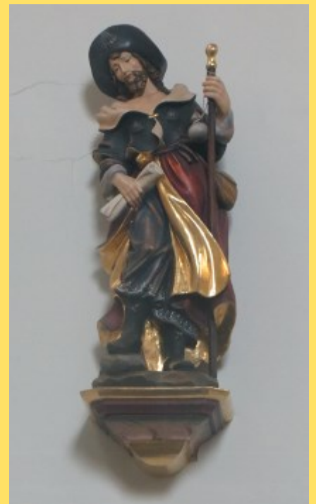
Saint-Jacques - Lierre