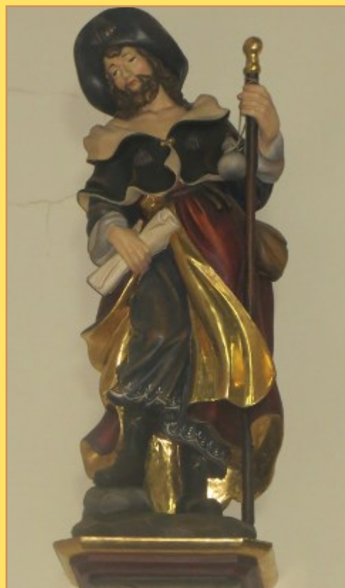
Statue de Saint-Jacques, Chapelle Saint-Jacques—Lierre