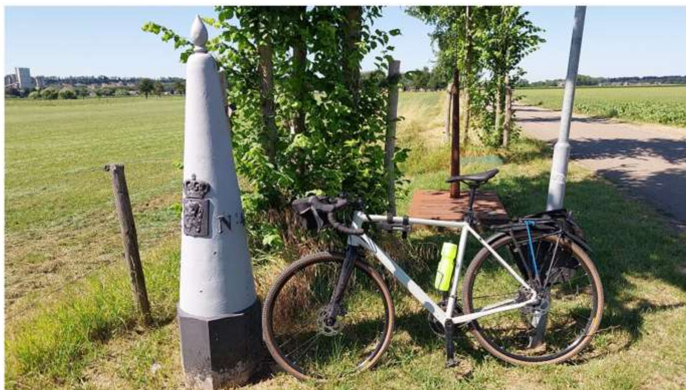
Via Mosana - Frontière belgo-néerlandaise entre Maastricht et Liège