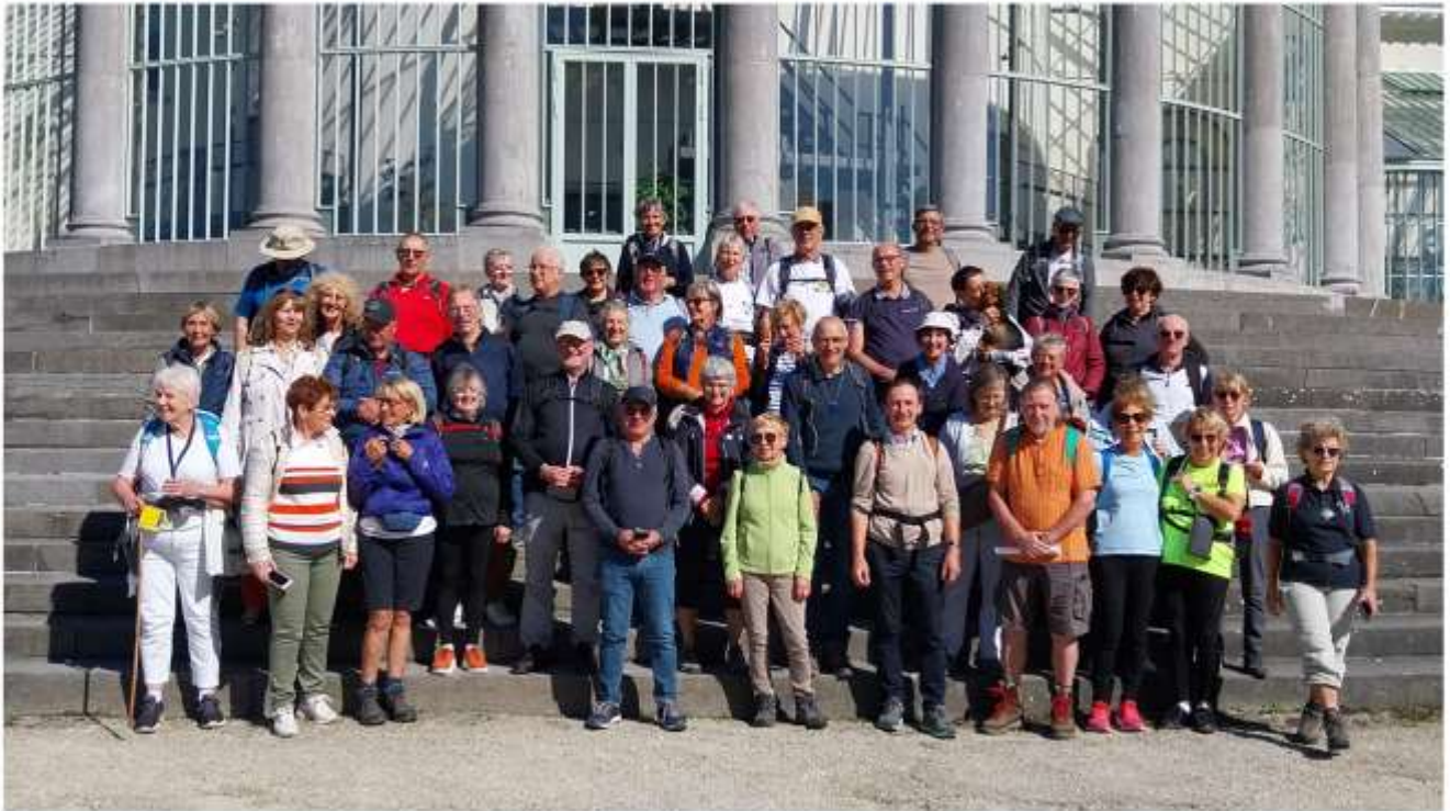
Traversée de Bruxelles par la Via Brabantica, en compagnie de nos amis de l'association Saint-Jacques en Boulangrie (24 septembre 2023)