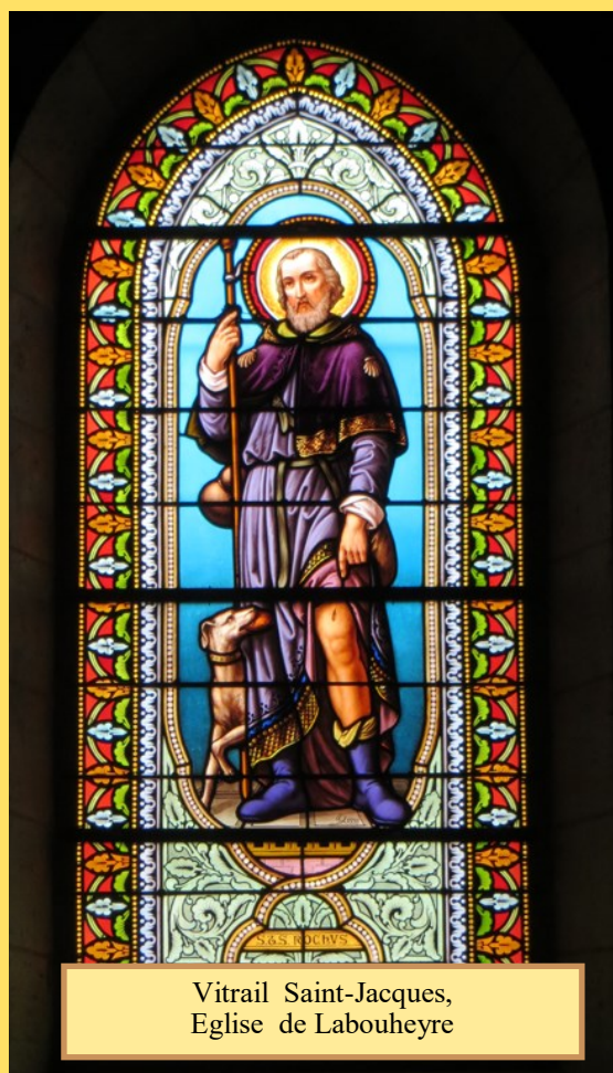
Vitrail Saint-Jacques, Eglise de Labouheyre