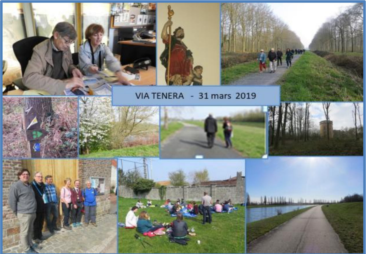
VIA TENERA - 31 mars 2019